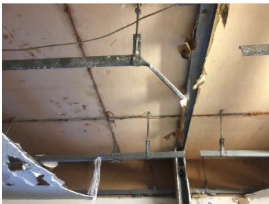
C 棟 5 階天井部分の損壊