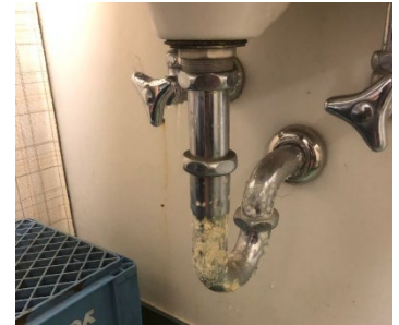
A 棟 2 階洗面台の水漏れ

掲載した 3 枚の写真のように、目に見える部分の損傷は随時修繕を行っていますが、見た目では確認できない壁の間に埋設されている水道管等の設備が老朽化している点が問題となっており、いつ大規模な損壊が起きてもおかしくない状況です。