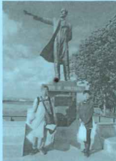
平成30年11月11日 除幕式(佐賀城公園)